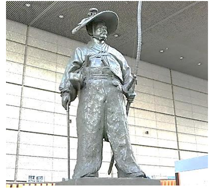
東京国際フォーラム道灌像